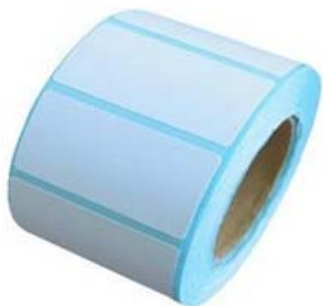
(70*22MM热敏不干胶条码纸) +

(打印的条码纸尺寸建议是 70*22MM 热敏不干胶条码纸。打印机建议用斑马 LP2844 条码打印机 )